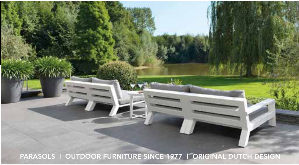
PARASOLS | OUTDOOR FURNITURE SINCE 1977 | ORIGINAL DUTCH DESIGN